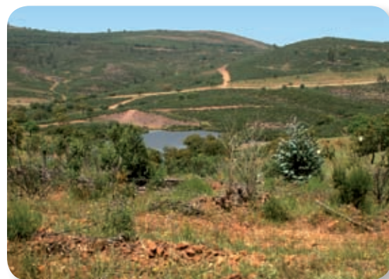
La Pantaneta es un pequeño embalse sobre el arroyo La Casquería, útil para las distintas actuaciones que se hacen en el monte público.

Tomamos dirección noreste, siguiendo las señalizaciones del sendero. Por debajo, a nuestra izquierda, vemos un pequeño embalse, llamado La Pantaneta, que recoge las aguas del arroyo La Casquería, que fluye hacia el embalse de Los Melonares, perteneciente al sistema de abastecimiento del área metropolitana de Sevilla.